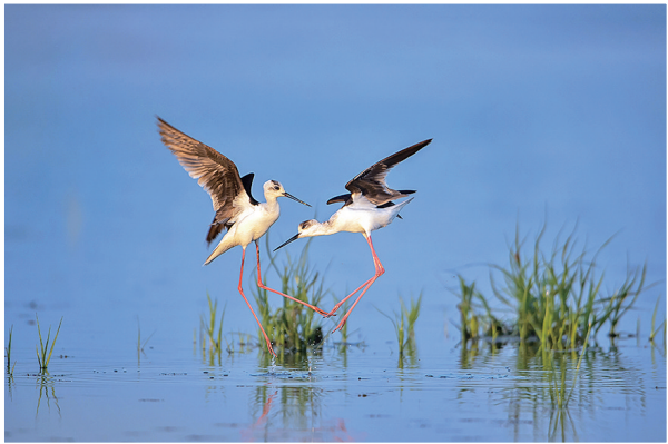
黑翅长脚鹬优雅起舞。