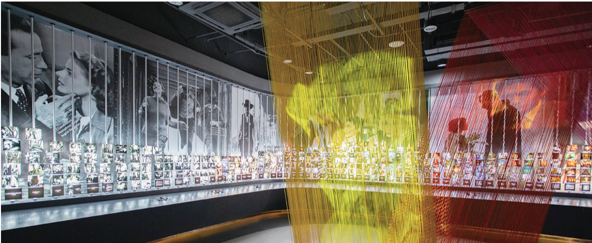
青岛电影博物馆世界厅。资料图