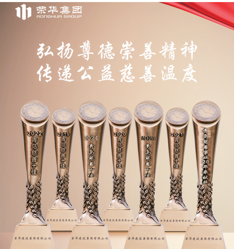
荣华建设集团荣获“青岛慈善十佳”等荣誉。