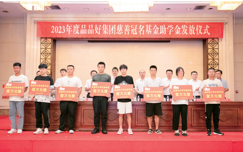
青岛品品好粮油集团向学子发放助学金。

在青岛这座有温度的城市里,涌现出了许许多多慈善典型,为树立慈善典型,激励先进,弘扬慈善文化,更大范围地凝聚慈善力量,青岛市慈善总会开展了“2024年青岛慈善十佳展示”活动,更加广泛地宣传慈善文化,推动青岛慈善事业取得新的进步。