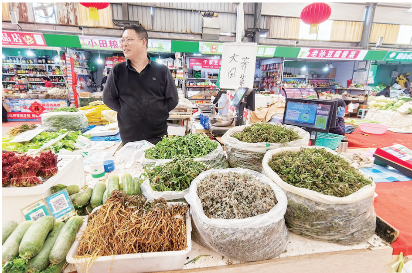
琳琅满目的春菜上市,市民选购春菜。