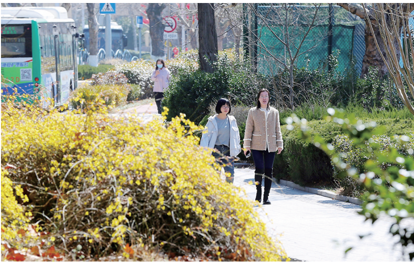
迎春花开,旅游业推出个性化深度游。

开放式厨房里,厨师正将刚采摘的石斛花轻轻抖入蛋液,随着铁锅翻炒,金黄与淡紫在火光中交融,一道“石斛花炒蛋”就出炉了。记者看到餐厅的菜单上有多种春菜菜品,餐厅经理指着冷链配送箱介绍,上午刚运来的春笋、香椿芽等春菜还带着露水,“春菜占了菜品销量的三成,尤其是香椿和春笋,高峰期需提前备货,顾客就爱这口山野灵气。”