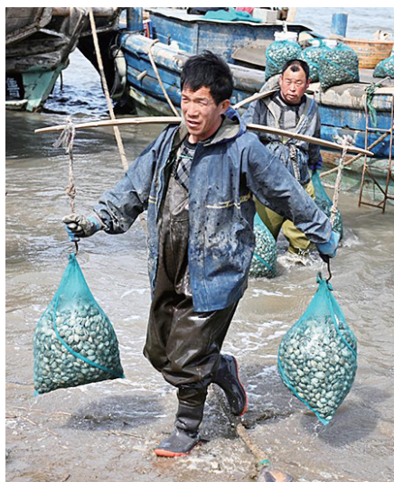
渔民将蛤蜊挑上岸。