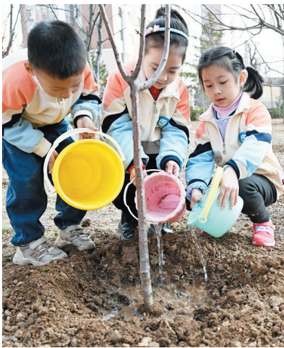
孩子们给刚种下的树苗浇水。

早报3月11日讯 3月11日上午,即墨区桃源河路幼儿园开展了一场意义非凡的植树节绿色环保实践主题活动。此次活动不仅让孩子们亲身感受到了春天的蓬勃生机,还在他们幼小的心灵中播下了爱护环境、植树造林的种子。