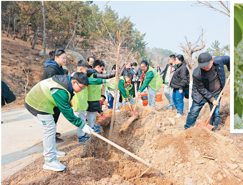
志愿者参与植树活动。

早报3月11日讯 3月9日上午,“植流苏花海 助乡村振兴”义务植树公益行动在崂山西麓少山社区举行,近200名城阳区志愿者种下了100余株10多年树龄的流苏树。少山社区有一棵树龄近300年的古流苏树,树高15米,每年4月底时花开如雪,引来众多游人。从2023年起,城阳区相关部门组织志愿者投身少山社区的义务植树与管护活动。目前,少山社区累计种植流苏树近1000株,流苏林已初具规模。