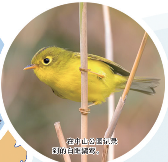
在中山公园记录到的白眶鹟莺。