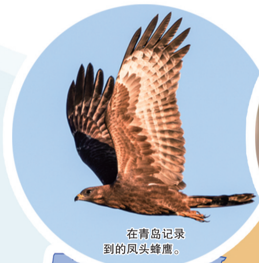
在青岛记录到的凤头蜂鹰。