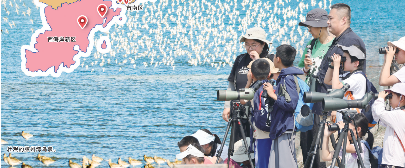
青岛市观鸟协会组织市民参与观鸟活动。