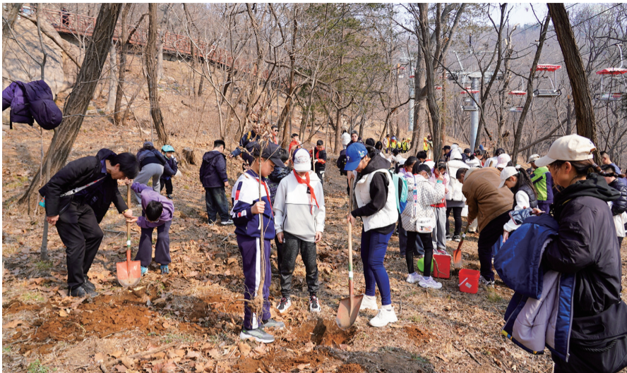
市民参与义务植树活动。

据悉,今年岛城相关部门推出“浇个朋友”——互联网+全民义务植树绿色市集,联合绿植企业、绿色