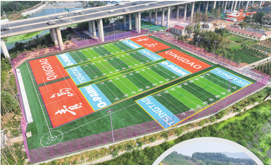
橙岛时尚体育公园

老旧改造众口难调,“改哪里”“怎么改”“改成什么样”,居民最有发言权。浮山新区街道推出了“三问于民”的工作法:改造前“问需于民”、改造中“问计于民”、改造后“问效于民”,寻求改造意见“最大公约数”。