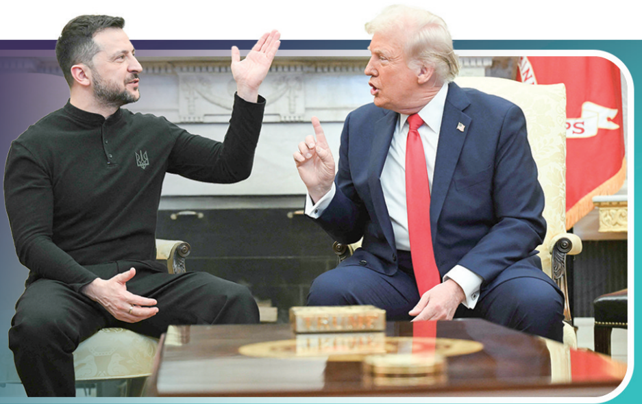
2月28日,美国总统特朗普(右)与乌克兰总统泽连斯基爆发争吵。 新华社发