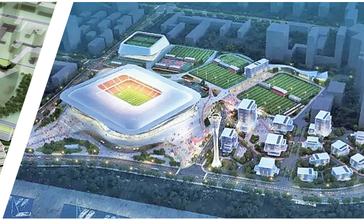
组图:永保国际文体公园项目效果图。

入青岛的门户位置,228国道在基地北侧,与蓝湾漫道交会,轨道交通13号线从基地周边通过,区位条件优越。基地位于灵山湾商业中心,背靠珠山国家级风景区,面朝黄海,战略地位突出,周边服务规划常住人口超过100万。