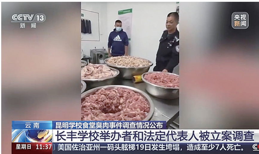
央视报道视频截图。