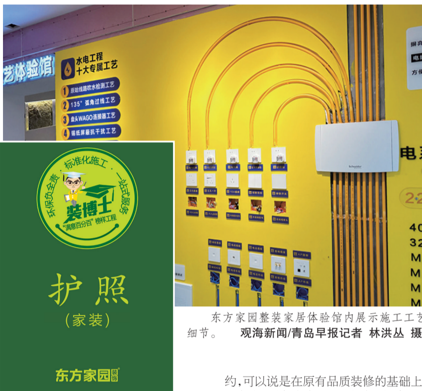
东方家园整装家居体验馆内展示施工工艺细节。

在谈及发布家装自律公约初衷时,东方家园装饰董事长王建华告诉记者,装修其实属于陌生消费,传统的家庭装修基本上是“一锤子买卖”。装修业主的理想是“省心、省事、省钱、省力”,而事实上服务提供商在每一个装修环节都有可能出现问题。家装行业的低频属性和单次博弈,导致行业口碑的建立需经历更长的无回报期,因此不少企业不愿意“从长计议”,这也是家装行业各种不规范行为长期存在的主要原因。