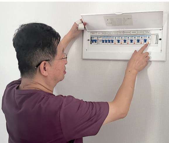
验房师检查配电箱。