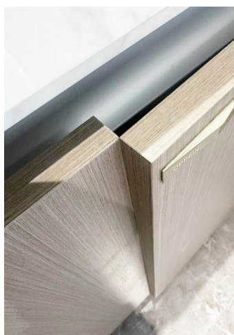
柜体门板关闭不严。