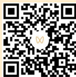
扫码观看 相关视频