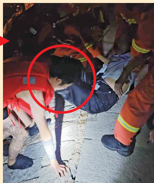
热心青年帮忙将老人抬上岸。本组图片均为视频截图