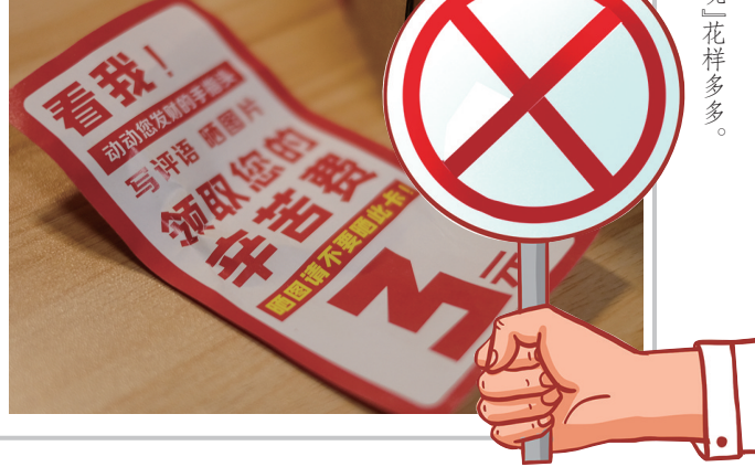
组图:「好评返现」花样多多。

家“堵嘴”,只会误导其他不知情的消费者,影响平台信誉,扰乱消费市场,助长不正风气。