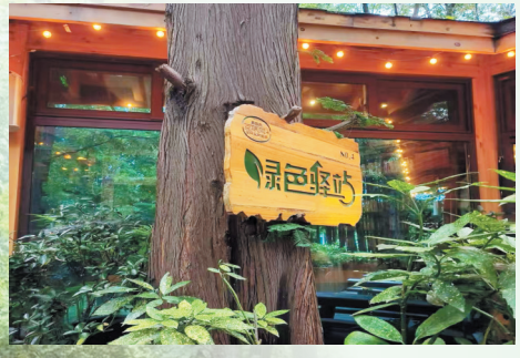
组图：温馨雅致的林荫书屋。