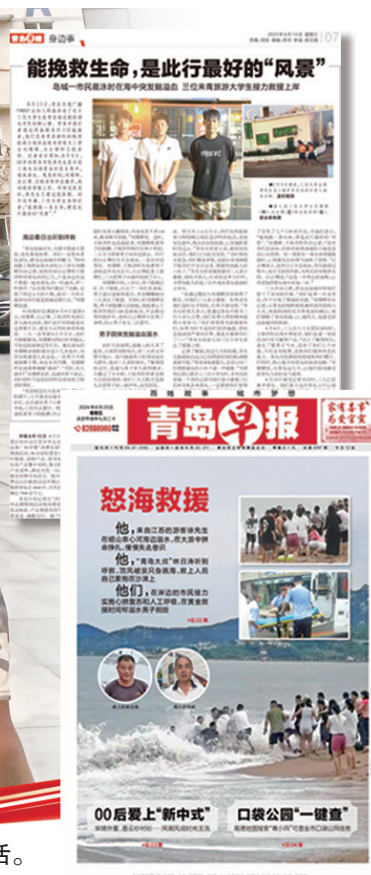
青岛早报相关版面截图。