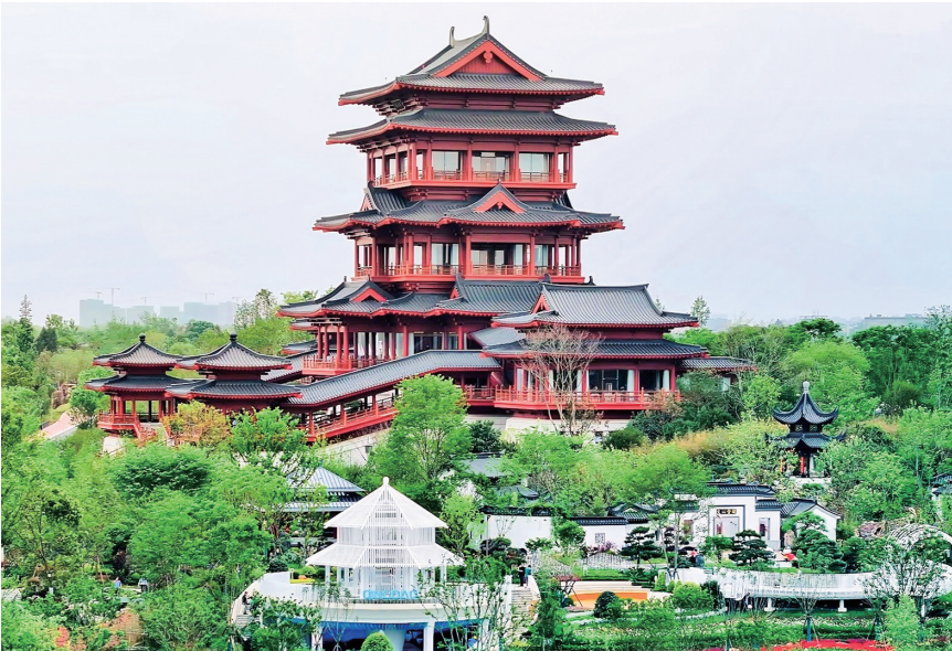
2024年成都世界园艺博览会现场。

本届世园会展园总数、境外展园数量、协会和企业展园数量均创下历届B类世园会之最。主会场占地面积3633亩,布局七大展区,设置6个室内场馆和113个室外展园,其中国际展园39个。