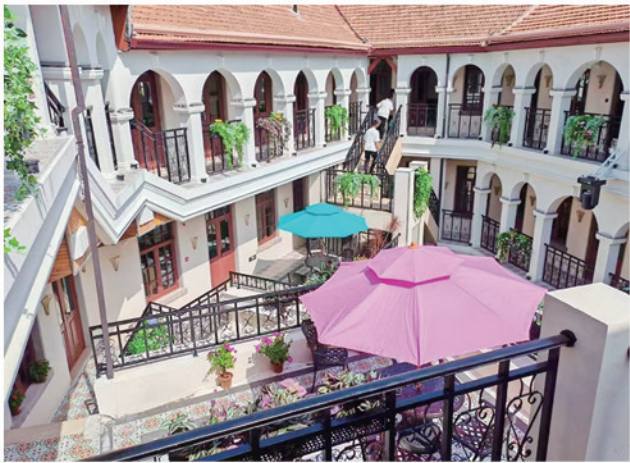
▲青岛·古巴文化交流中心落户经畬里。 ▶斑马线迎来了“大变样”。