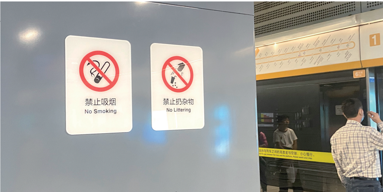
地铁站内张贴着禁止吸烟标志。

“吸烟有害健康”，相信每个人都听过这句话。然而，中国疾病预防控制中心慢性非传染性疾病预防控制中心研究团队今年1月发表的《2019—2020年中国40岁及以上人群二手烟暴露状况分析》显示，2019年中国40岁以上人群二手烟暴露率达到46.4%，家庭、工作场所等是接触二手烟的主要场所。今年5月31日是第37个世界无烟日，青岛早报记者走访了人流集中的火车站、商场、餐馆等处，探访公共场所禁烟情况，并围绕市民对在公共场所吸烟的看法进行了随机采访。