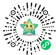
扫描小程序码 参与奉献爱心