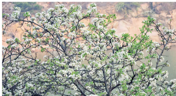
大珠山景区的海棠花。