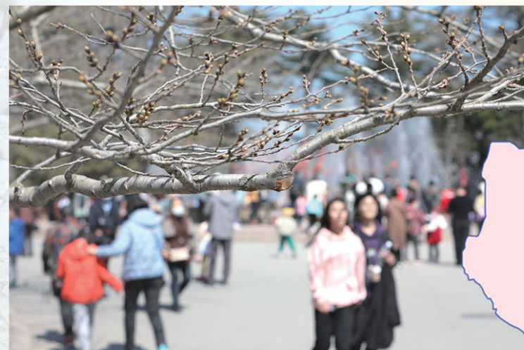
中山公园的樱花含苞待放。

解放后,青岛的樱花会更名为“春季游园会”,每到中山公园樱花盛开时,园内会有上百个商业摊位云集,七八个展览同时开展。上世纪50年代,每年都有上百万人参加游园会,人们把青岛中山公园与武汉珞珈山并列作为国内两大赏樱之地。