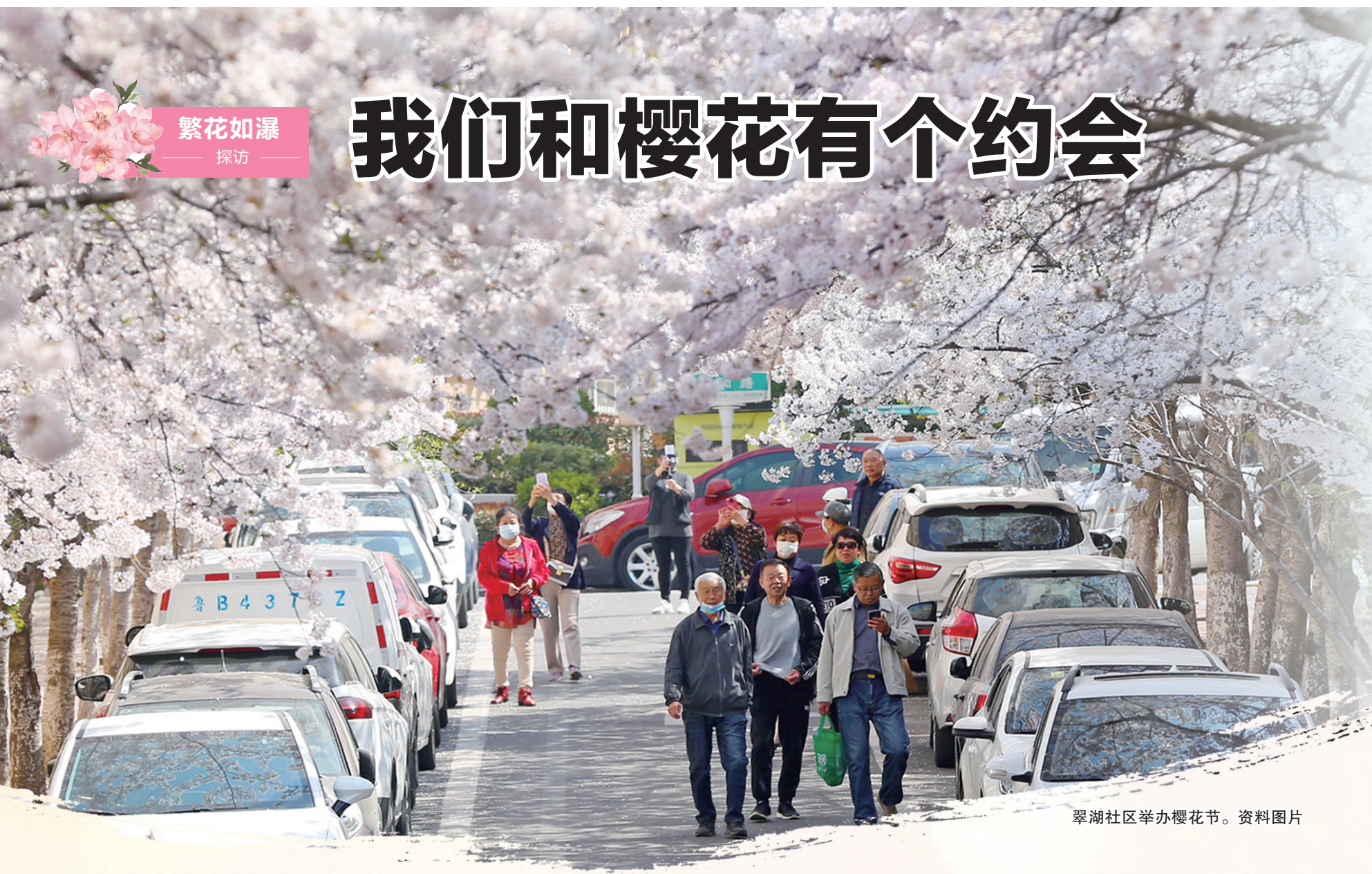
翠湖社区举办樱花节。资料图片

进入春季,青岛各种鲜花依次开放,从蜡梅到迎春、连翘,再到玉兰、樱花、杏花……它们点缀着城市的大街小巷,展现着勃勃生机。如果要问哪一种花最能调动青岛人的情绪,开门“出门俱是看花人”,想必不少人会给出“樱花”的答案。每年从3月底开始直到4月末,是青岛樱花的花期。3月23日、24日,记者分别来到中山公园、三明南路以及翠湖小区、中国海洋大学崂山校区等青岛赏樱胜地,打探花开消息,为市民和游客绘制一幅青岛赏樱地图。据专家预测,今年的樱花花期会比常年平均日期提前1至3天,但要比去年晚一周以上。