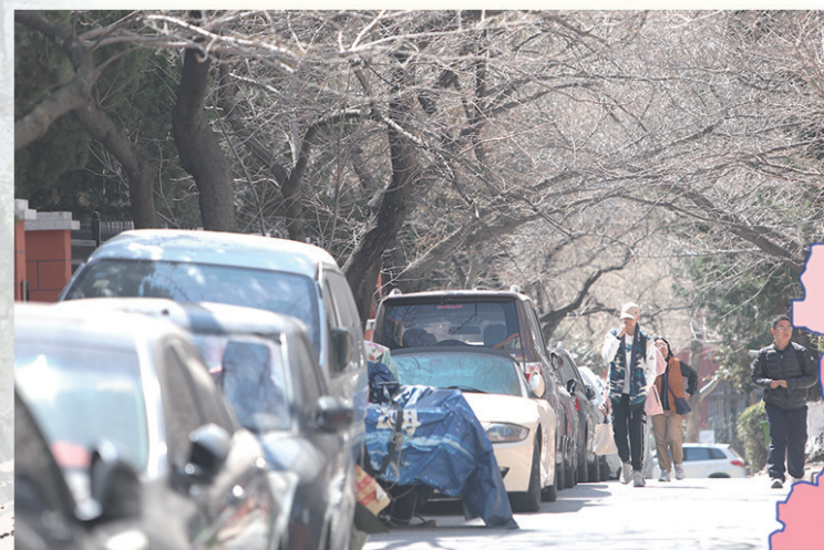
三明南路的樱花花蕾正积蓄着开放的力量。