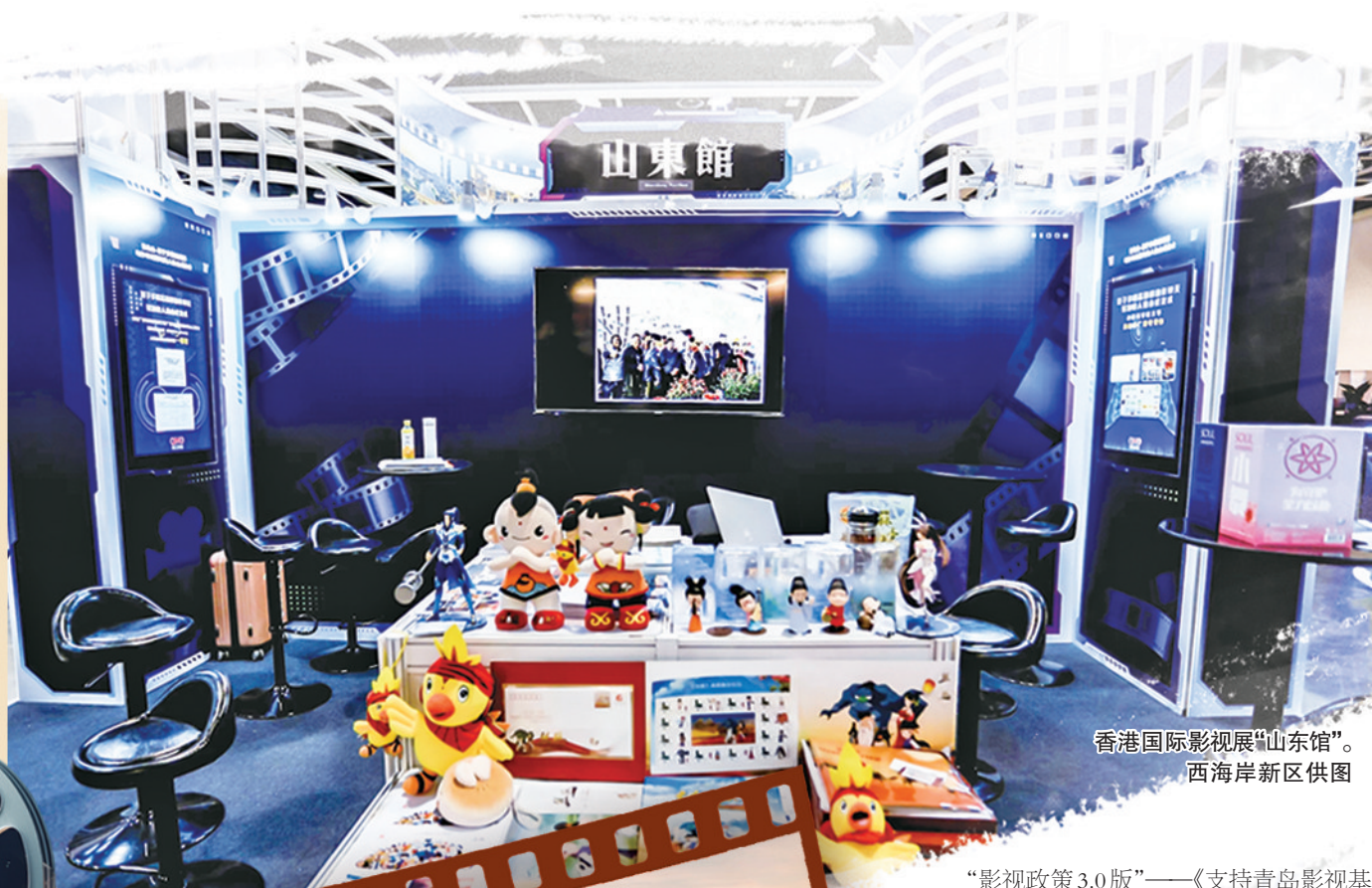
香港国际影视展“山东馆”。

青岛是联合国教科文组织授予的中国首个“世界电影之都”,有“天然摄影棚”和“影视梦工厂”之称。目前,青岛已经形成了特色鲜明、优势互补的影视产业布局,东方影都产业园、中山路历史城区、东唐影视产业园、胶州湾湾轴胡同等重点影视取景地,共同构建起青岛海滨景观、万国建筑、空港基地等多类别拍摄场景。