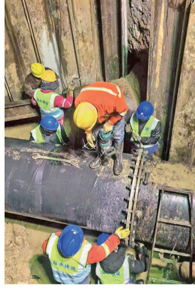
金水路供水管线迁改工程施工现场。

早报3月6日讯 为配合重点工程东岸产业园区基础设施综合改造项目建设及地铁2号线二期工程下王埠站施工建设,3月5日,青岛水务海润自来水集团抢抓工期,顺利完成金水