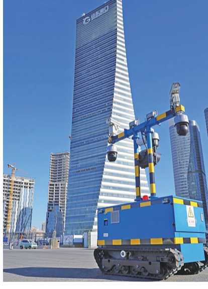
国内首创全场景智能远控理货机器人。

全场景智能远控理货机器人可实现5G、有线、无线网桥三种网络传输方式,使用时选择最适合的传输方式,视频数据回传更加稳定、便捷。视频数据信息还实时传输至后台服务器,数据保存便于后期查询,提高理货服务质量。同时,机器人还设计有两种五个摄像头,实