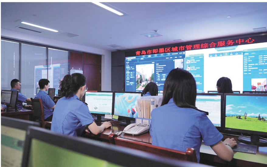
青岛市即墨区城市管理综合服务中心。