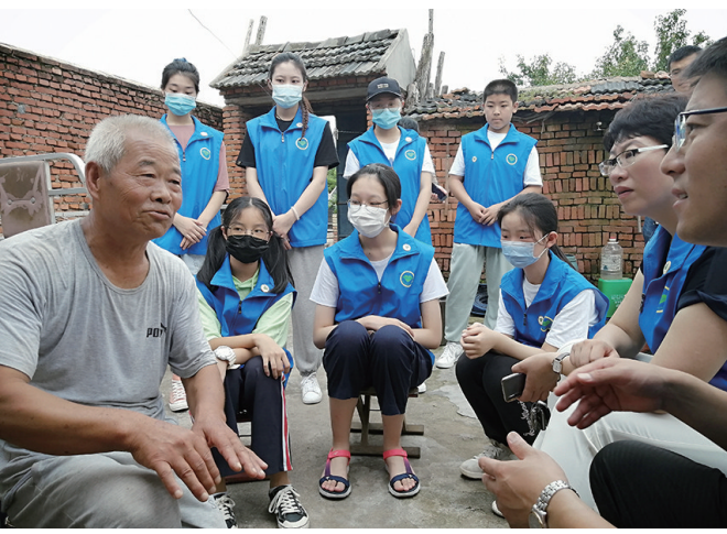
志愿者经常组织助残活动。

为何要设立见义勇为基金,重奖好人?张新语重心长地说:“精准助残是协会的宗旨。实际上,在做好公益慈善的同时,也正是弘扬传播正能量的最好时机,一件好事能扩大社会公益效应,影响更多人加入公益慈善,用大爱精神感召更多人来做好事,从而形成一种良好的向善仁爱社会风气,这样社会更加和谐,促进政