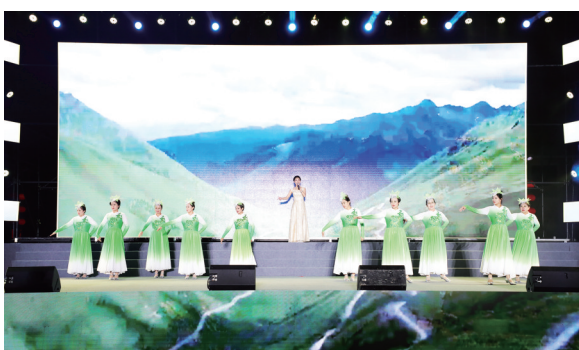
龙山街道葛村新村第一届文化艺术节晚会现场。