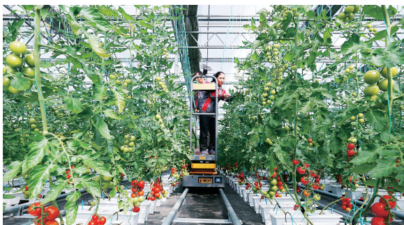
在即墨区北安街道祥坤智慧农场,农民在管理无土栽培的小番茄。