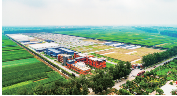
即墨区移风店镇“七彩田园”汇聚尖端种子资源,促进种业振兴。图为荷兰瑞克斯旺公司中国总部。