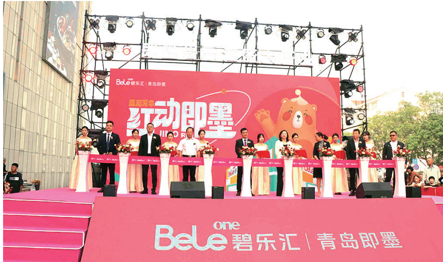
即墨碧乐汇项目盛大开业。

据介绍,青岛即墨碧乐汇招商率97%、开业率97%,搭载了潮玩互动空间、沉浸式儿童体验乐园、多地特色美食以及多维的体验空间,引入标杆亮点品牌、首进品牌、体验业态超70%,其中包括首进即墨大型电竞酒店Solo