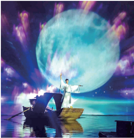
组图：“双节”期间，莱西市将举办丰富高品质的文旅活动。

今年“双节”期间，莱西市将举办30余个重点节庆活动，丰富高品质文旅产品供给，提升景区游客体验，持续打造“莱西周末”旅游品牌。