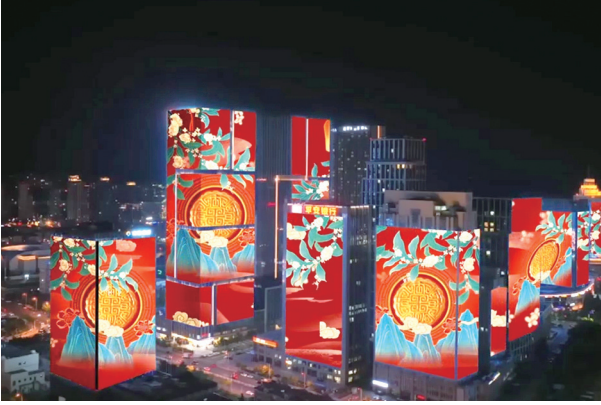
崂山区主题灯光秀效果图。