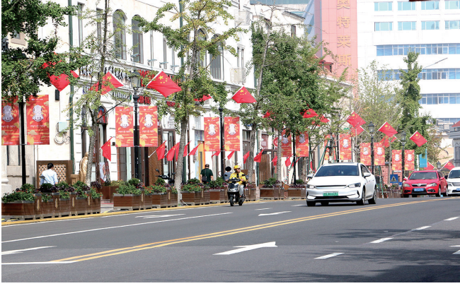
中山路节日气氛浓厚。