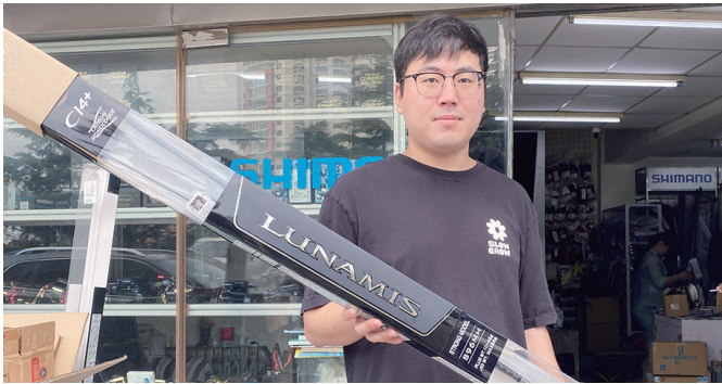
钓具升级换代很快，不要追求“一步到位”。