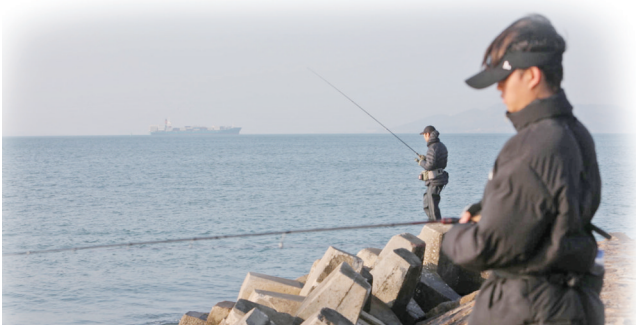
很多新手钓鱼，从矶钓和远投开始。