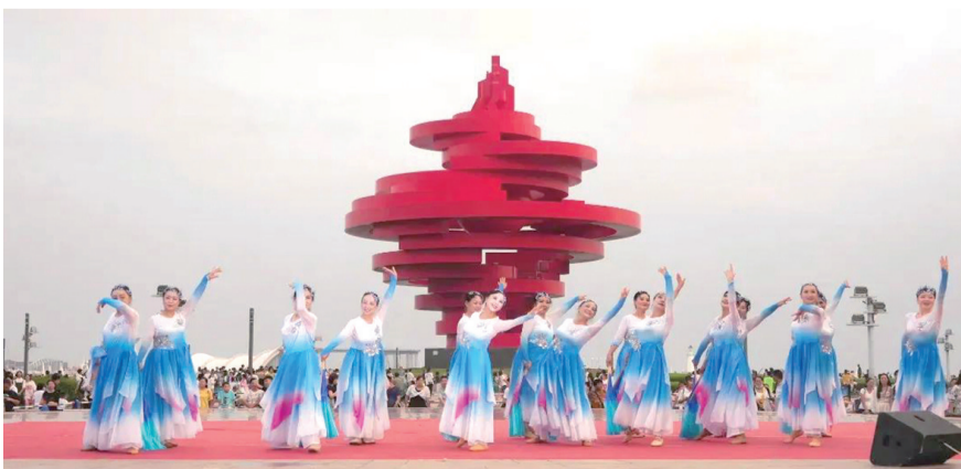
选手们在比赛现场秀才艺。