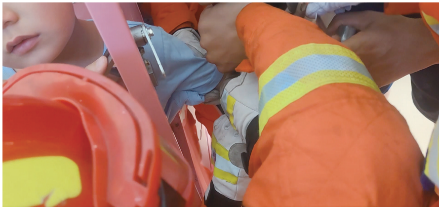
消防救援人员紧急施救