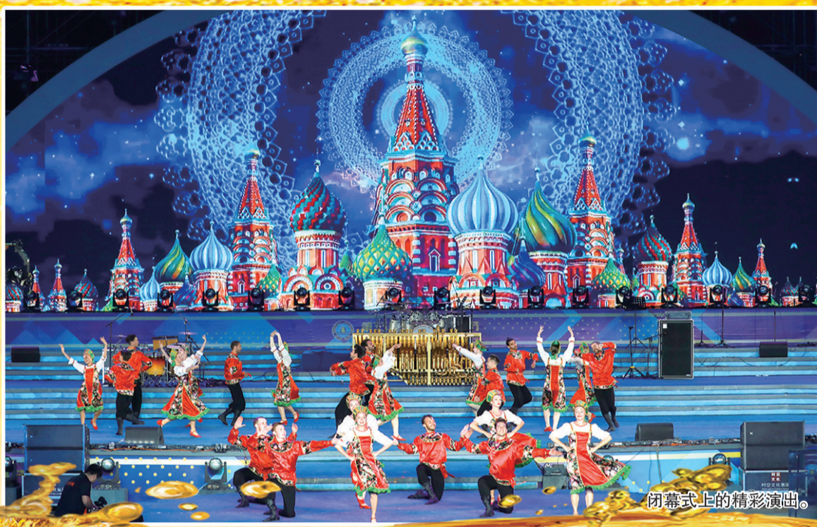
闭幕式上的精彩演出。