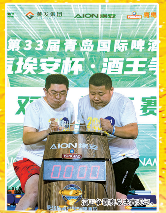
酒王争霸赛总决赛现场。