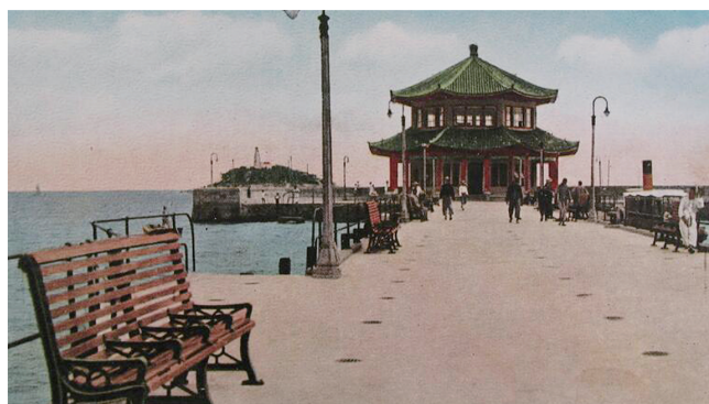
初建成的回澜阁,回看万家灯火。