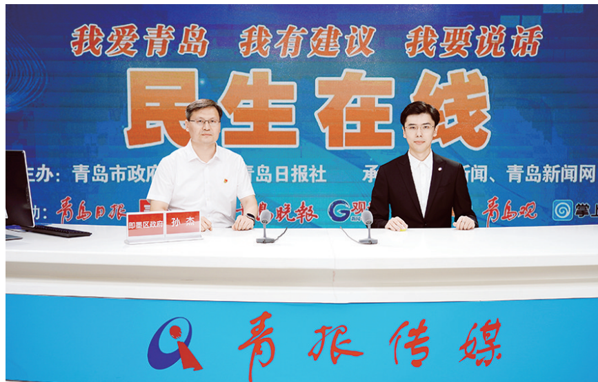
孙杰(左)做客民生在线。

早报7月25日讯 7月25日下午,即墨区委副书记、区长孙杰做客民生在线,围绕“一心为民、真诚服务”主题,与网友在线交流。孙杰表示,保障和改善民生是一切工作的出发点和落脚点,即墨区始终坚持把民生工作摆在首位,全力保障必要的民生支出,持续改善群众生活环境,提升群众生活品质。