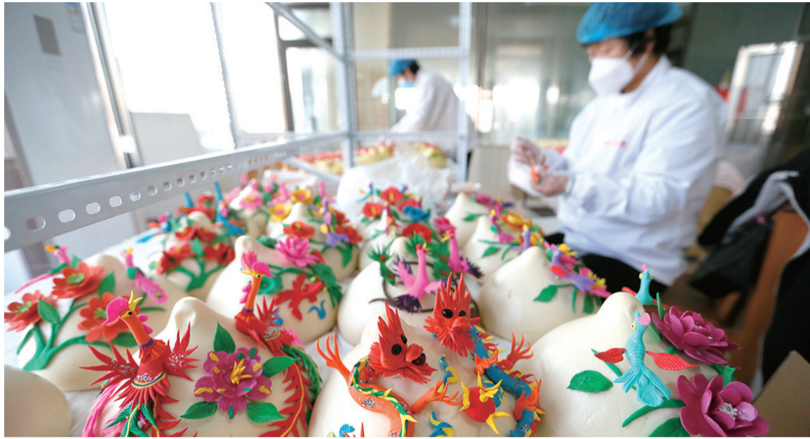
即墨区田横镇王村新村党组织领办馒头合作社。

多年以来,即墨区累计选派223名驻村第一书记和工作队员抓党建促脱贫攻坚、促乡村振兴,实现对脱贫村、党组织软弱涣散村、乡村振兴任务重的村全覆盖。创新开展“千名干部联企业·万名党员联群众”等主题实践活动,推动区直部门单位、上万名党员干部,下沉农村一线为群众办实事、解难题。即墨区财政每年新增补助资金1809万元,提高村级组织运转保障水平。优化村级党群服务中心(站)功能,按照有红色基因、有时代气息、有浓浓乡愁、有本