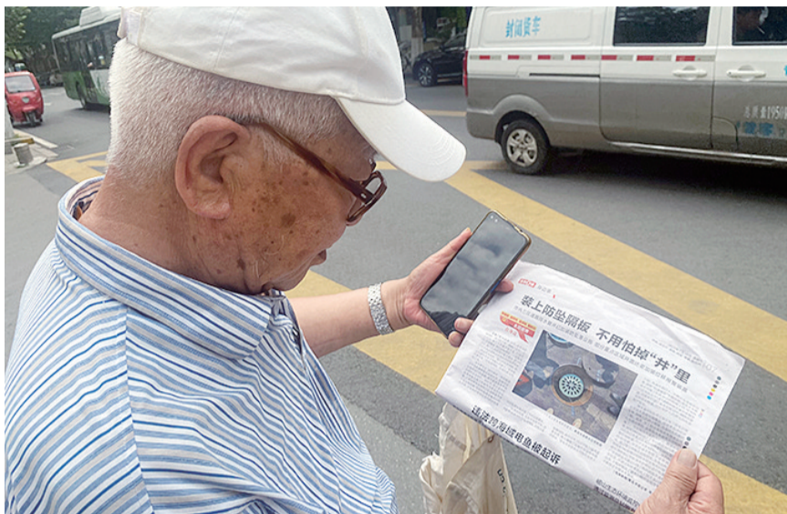
王先生拿着早报说：“就是这篇报道，让我想到找早报帮忙。”

7月16日上午10点，青岛早报记者前往现场实地探访，刚行至路口，就听到了路上传来的“哐当”声，循声望去，很快便发现了源头——嘉定路16号与17号马路中间的两个井盖，只要有车子轧过