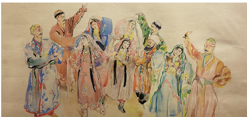
司徒乔美术作品。主办方供图

“他有时将他自己所固有的明丽,照破黄埃。”许多人知晓司徒乔的画,是从鲁迅先生的文学作品《看司徒乔君的画》中所知,近日,岛城观众就有眼福,在青岛市美术馆欣赏到这位美术大家的艺术作品。由新疆维吾尔自治区文化和旅游厅、青岛市文化和旅游局指导,新疆美术馆、青岛市美术馆主办的“画尽人间百态——新疆美术馆藏司徒乔水彩作品展”于6月13日启幕,展出截至7月16日。此次展览也是新疆美术馆首次组织馆藏精品赴内地省市美术馆展出。