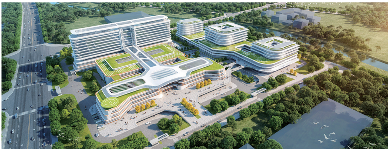
青岛大学医学医疗中心项目效果图。

该项目的签约落地是西海岸新区落实全市城市更新和城市建设三年行动和“创建国家区域医疗中心、建设长江以北地区一流医疗中心城市”的重要举措,也是新区建设半岛区域医疗中心的重要行动。