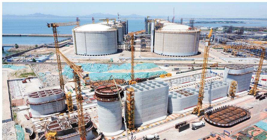
董家口港区第二座40万吨矿石泊位工程。