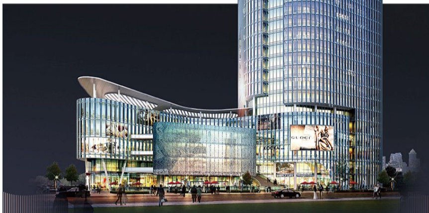
华通·海方科创园项目大楼效果图。

据介绍,电子竞技是广受年轻人热爱的项目,其背后不仅是一条串起硬件、软件、销售、服务、赛事、培训、游戏等多个领域的全产业链,还在一定程度上代表着城市的青春活力。华通·海方科创园项目以电竞科技产业为主中心,将着力打造多元一体的电竞科技和智慧数字发展平台,开启即墨电竞产业新纪元。