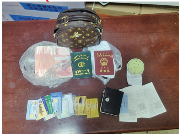
王女士的背包内装有现金、银行卡、身份证等贵重物品。