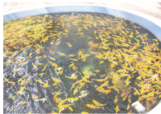
藏马镇石榴树下农业生态园的鱼菜共生鱼池。