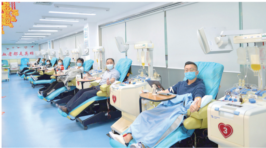
越来越多的爱心市民参与无偿献血。

早报5月30日讯 记者从青岛市中心血站获悉,即日起,全市57家公立医院设立享受“三免政策”献血者专用挂号窗口,凭无偿献血荣誉卡,可免普通门诊诊查费(普通挂号费)。这是对持有“无偿献血荣誉卡”的爱心市民,在此前免公共交通、健康体检、部分景点门票“三免”政策的升级。青岛有2.3万余名爱心市民可享受“四免”福利。