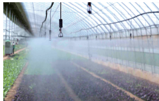
青岛盛客隆农业园的智能喷灌系统。