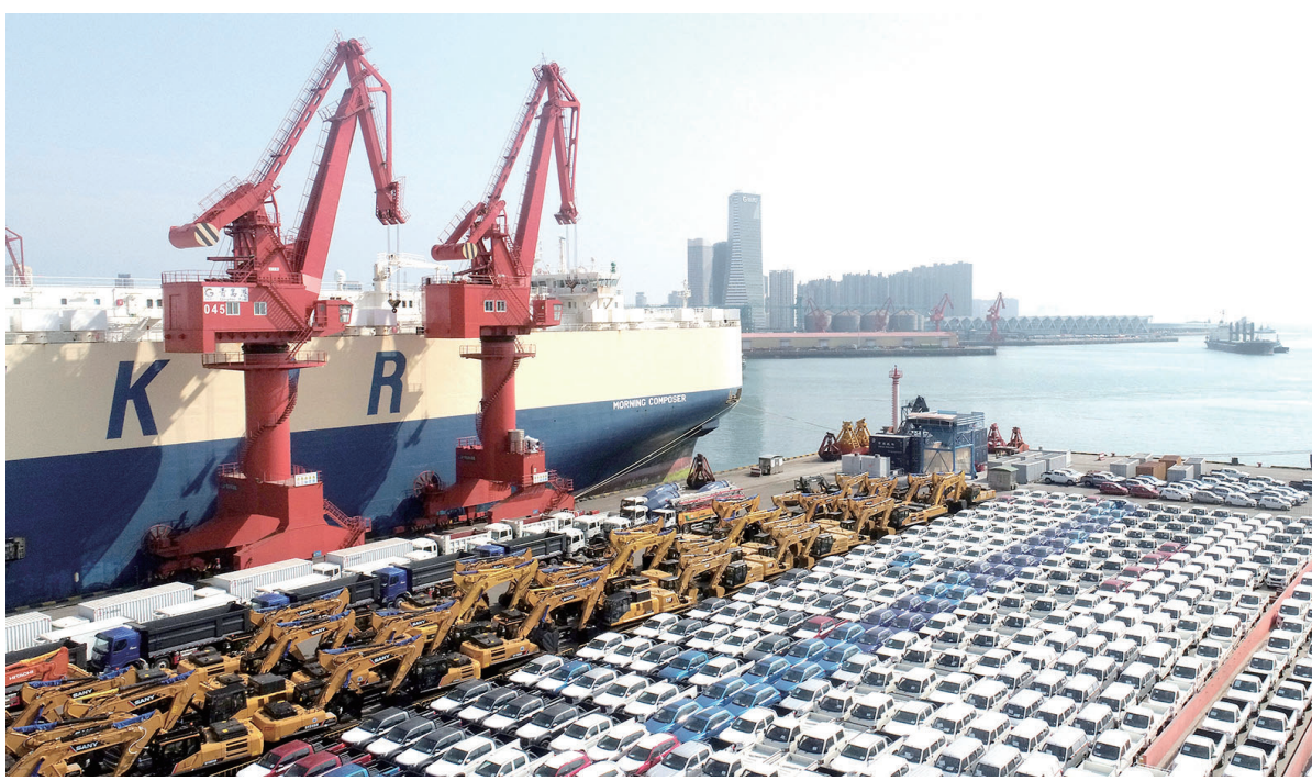
山东港口青岛港商品车码头作业现场。