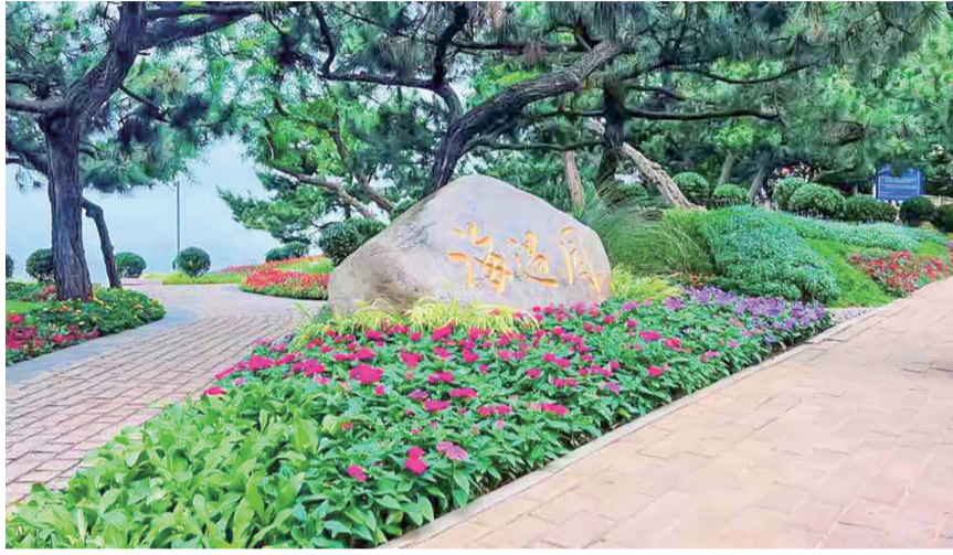
海遇园成为休闲好去处。资料图片

4月29日上午,在第四届青岛花卉博览会暨第十八届桔桃花会开幕式上,2022年度青岛市十佳口袋公园发布,市南区海遇园位列其中。这个位于太平角一路与湛山四路交叉路口的口袋公园,面积约2100平方米,突出城市印记,将原本局促的入口空间打开,改造为观海大台阶,增设了“景框”与坐凳。从栈道向内望去,“景框”里是一幅以繁花绿植为主题的生态画卷;而从公园内向海边望去,“景框”里是碧海蓝天的岛城标志性