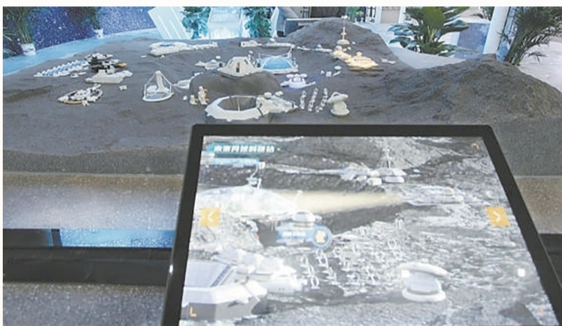
未来“月球科研站”沙盘。