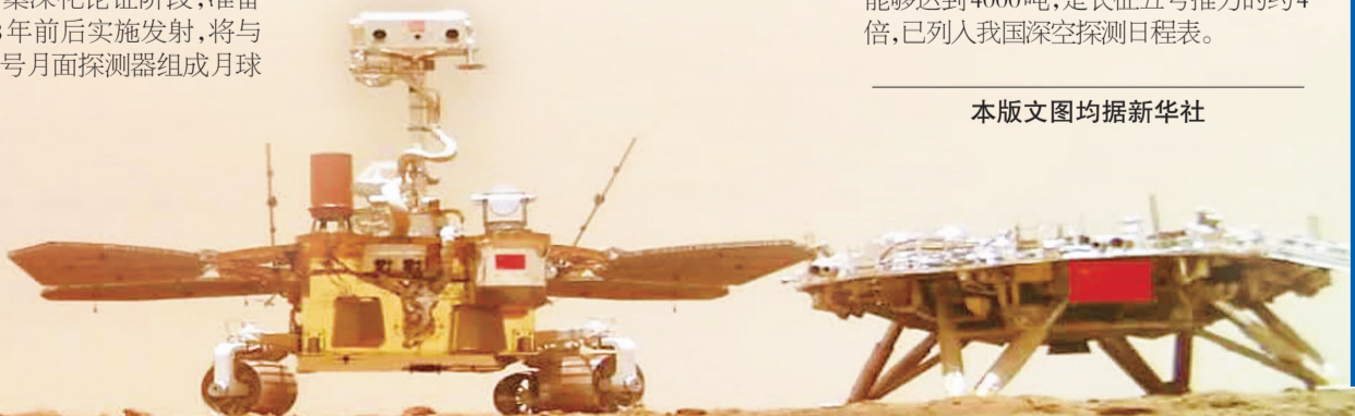
祝融号火星车拍摄的“着巡合影”图。