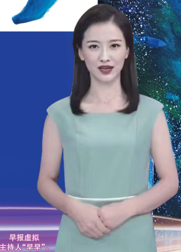
早报虚拟主持人“早早”。