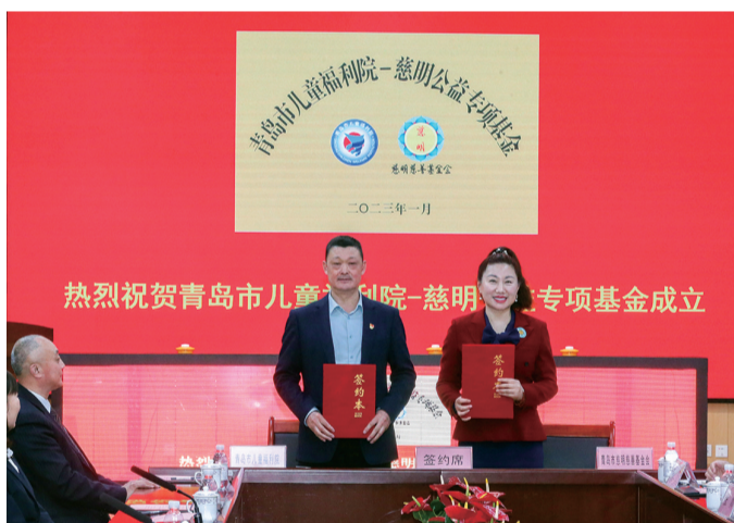
3月3日，“青岛市儿童福利院-慈明公益专项基金”签约揭牌。

为每一位特需儿童撑起一把爱的小伞。3月3日，青岛市儿童福利院、青岛市慈明慈善基金会签订合作协议，“青岛市儿童福利院-慈明公益专项基金”正式揭牌运行。专项基金除了定向、精准帮助特需儿童改善学习生活环境，还将关注儿童福利院里的“爱心妈妈”，感召更多社会爱心人士加入“爱心妈妈”志愿行动，提升志愿者的幸福感和荣誉感，凝聚力量一起为特需儿童提供最优质的照护。