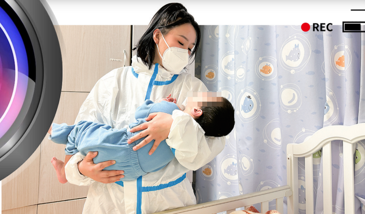
「爱心妈妈」在市儿童福利院照护孩子。