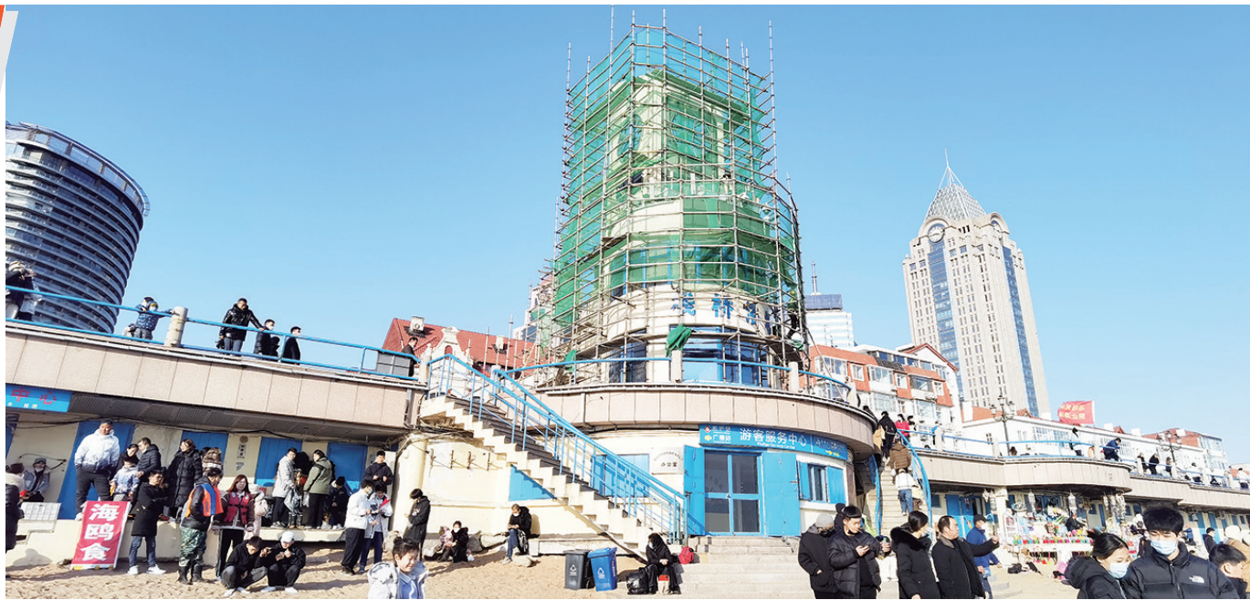
栈桥海水浴场钟表楼已开始启动改造提升工程。

1月30日下午,记者在栈桥海水浴场看到,建成已36年的钟表楼及部分更衣室已启动修缮提升,主要是做加固维修,保留原建筑结构功能的同时,将增添局部设计,改造后造型类似一艘驶向海中的大船船头,营造“乘风破浪”的感觉,预计今年4月底完工。