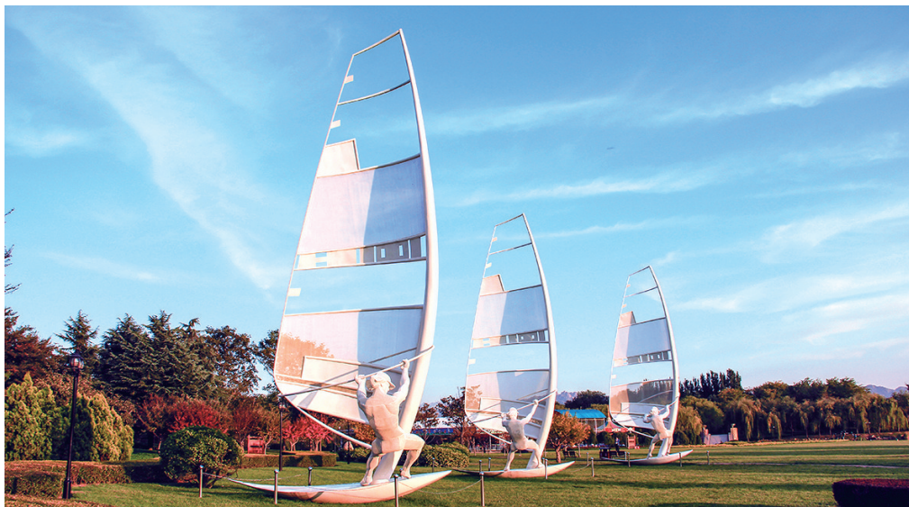
青岛奥林匹克雕塑文化园。 资料图片

记者了解到,即墨古城不仅保护传统本地非遗项目,而且还将云超绘瓷、扬州漆器、曲阳石雕、茉莉花茶窰制技艺、木版年画、高家糖球、胶东大馒头、蔚县剪纸等一批全国非遗项目引入即墨,和古城历史文化相融,形成一种互相传承,互学互鉴的文化融合新气象。(观海新闻/青岛早报 记者 康晓欢 通讯员 宫磊 摄影报道)