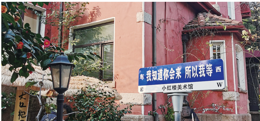
小红楼美术馆的路标。

青岛奥林匹克雕塑文化园位于城阳区绿色中轴线的南端,为国家4A级旅游景区,总占地面积645亩,于2003年6月建成并免费开放。公园以“三山一水一湖三岛一滩”为整体布局,依托不同地貌,将园区规划为16个风格不同的生态景观园,并将体育文化、健身设施融入景观设计,形成独特的园林风格。从东门进入看到的是2008年北京奥运会获得金牌的中国运动员的雕像群,从北门进入看到的是世界奥林匹克文化大道,这里是广大市民尤其是青少年进行社会实践活动和奥林匹克精神教育的重要场所。(观海新闻/青报全媒体记者 张羽)